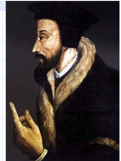
Жан Кальвин (1509—1564)