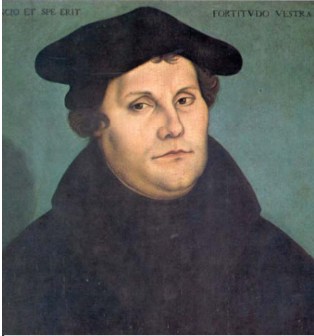
Мартин Лютер (1483-1546)