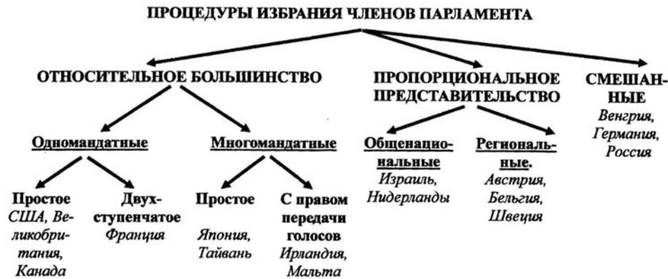
Рис. 2. Классификация процедур избрания членов парламента

Президентские выборы могут проходить вместе с парламентскими или независимо от них (см. рис. 3).