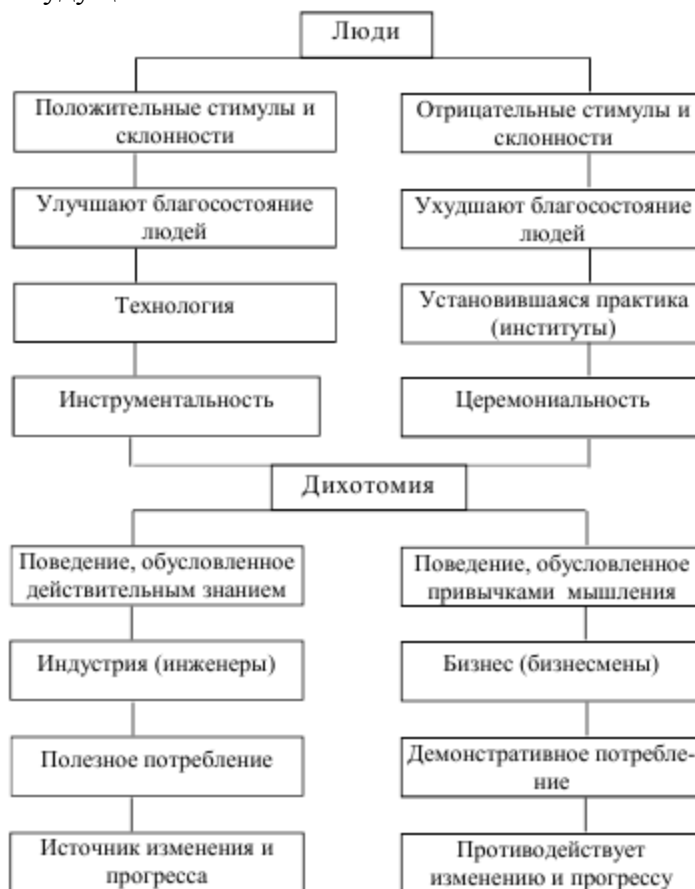
Рис. 1. Дихотомия Веблена

изменения прогресса, а второе - как фактор, который противодействует ему (см. Рис. 1). В работах, написанных в годы первой мировой войны и после нее – «Инстинкт мастерства и состояние промышленных умений» (1914), «Место науки в современной цивилизации» (1919), «Инженеры и система цен» (1921) – Т. Веблен рассматривал важные проблемы научно-технического прогресса и показывал роль инженеров-менеджеров в создании рациональной промышленной системы. Именно с ними он связывал будущее капитализма.