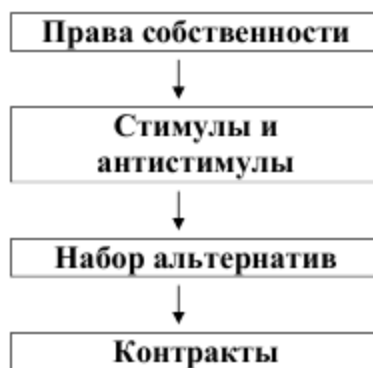
Рис. 4. Реализация прав собственности в контрактах

Процесс формализации ограничений связан с повышением их отдачи и снижением издержек путем введения единых стандартов. Издержки защиты правил связаны, в свою очередь, с установлением факта нарушения, измерением его степени и наказанием нарушителя, при условии что предельные выгоды превышают предельные издержки, или, во всяком случае, не выше их ( MB > MC ). Права собственности реализуются через систему стимулов (антистимулов) в наборе альтернатив, стоящих перед экономическими агентами. Выбор определенного направления действий завершается заключением контракта (см. Рис. 4).